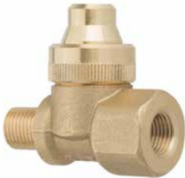
1/4" M.F. /MH

Accessorio antigoccia a membrana con possibilità di utilizzo fisso o orientabile con snodo sferico.