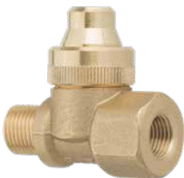
1/2" M.F. /MH

Accesorio antigota de membrana con posibilidades de uso fijo o regulable, con junta esférica.